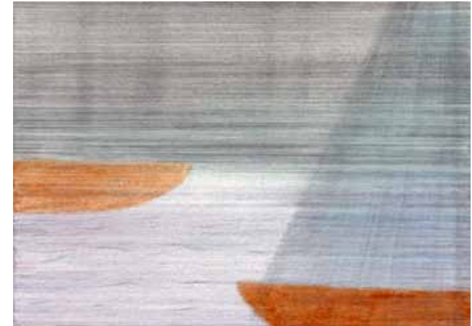
Antje Pehle | einschiffen | 2011 | Tusche, Bleistift, Buntstift | 10,5 x 15 cm