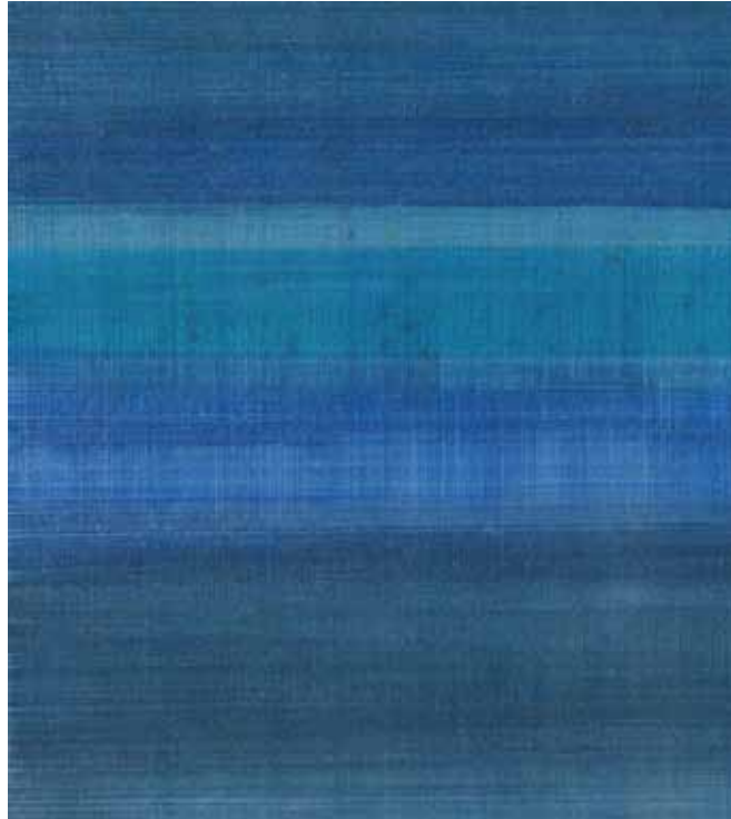
wenn ihr schläft (Detail) | 2010 | Tusche, Bleistift, Buntstift | 23 x 31 cm

1953 geboren in Berlin 1973–75 Ausbildung als Technischer Zeichner 1976–85 Auslandsreisen: Europa, Asien, Afrika, Nordamerika seit 1995 freischaffend: Malerei, Zeichnung, Fotografie seit 1997 Mitglied im BBK 1998–2000 Arbeitsstipendien Thüringische Sommerakademie seit 1999 regelmäßig Ausstellungen im In- und Ausland 1999 Projektförderung: Käthe-Dorsch-Stiftung (Katalog) 2001/02 Grafik-Webdesign (Artur-Speer-Akademie Berlin) 2005 Atelierstipendium der Senatsverwaltung Kultur, Berlin Atelierhaus Sigmaringer Straße 1 in Berlin-Wilmersdorf seit 2007 Mitglied im Verein Berliner Künstler (VBK) seit 2008 Vorstandsmitglied im VBK